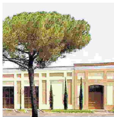
Rocca di Montemassi